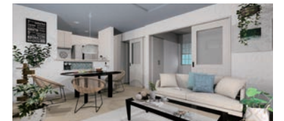
※イメージベースは図面を基に描き起こしたもので、実際とは異なります。