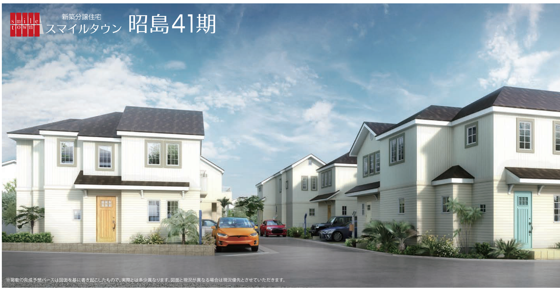
※掲載の完成予想ハースは図面を基に書き起こしたもので、実際とは多少異なります。図面と現況が異なる場合は現況優先とさせていただきます。